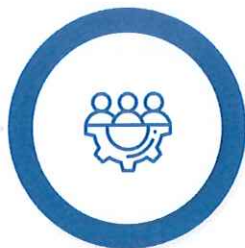
Măsuri suport în domeniul Ocupării