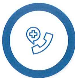
Ajutoarele de urgență (de la bugetul de stat și de la bugetul local)