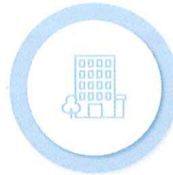
Măsuri suport în domeniul Locuirii