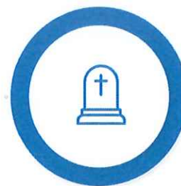
Ajutorul pentru înmormântare