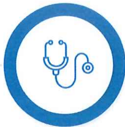
Măsuri suport în domeniul Sănătății