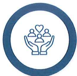
Măsuri suport în domeniul Serviciilor

În funcție de nevoile familiei/persoanei singure, venitul minim de incluziune este însoțit de alte măsuri de asistență socială complementare, acordate în bani și/sau în natură: