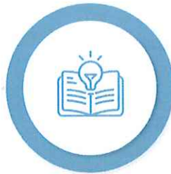
Măsuri suport în domeniul Educației